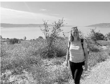
zicht op het meer van Galilea vanaf de berg der Zaligsprekingen

We hebben wat afgelopen tijdens onze 11-daagse reis door Israël. We hadden het grote voorrecht om met een reisgezelschap van 23 personen van Noord naar Zuid en van West naar Oost door het land te trekken. De bus deed gelukkig het meeste werk, maar de benenwagen legde ook heel wat kilometers af. Elke dag toonde weer een ander landschap en een ander beeld van de (Bijbelse) geschiedenis. Net als de discipelen hebben wij tijdens de Israëltreis Jezus gevolgd.